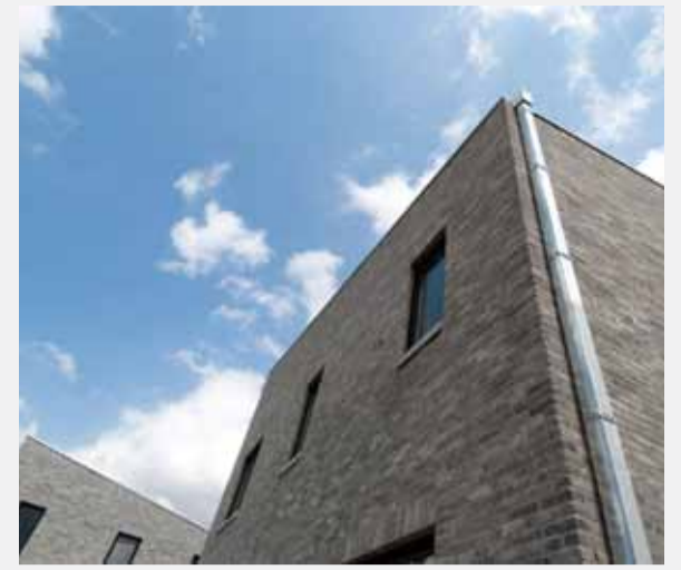
« Les innovations se manifestent parfois aussi dans les applications que l'on offre à certains produits. Ainsi, nos pavés ont été utilisés comme pierres de parement dans le projet anversois Regatta. »

Stradus Infra offre non seulement des produits de grande qualité pour créer des environnements inspirants, mais entend aussi transmettre un sentiment de responsabilisation sociétale et environnementale en termes de durabilité. « Preuve en est nos investissements dans les éoliennes et nos