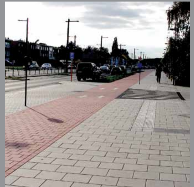
« En réunissant les deux chantiers, nous avons besoin de 85.000 m 2 de matériaux de pavage. Mais aussi 22 kilomètres de bordures. »

« Grâce à la large gamme de produits mis à notre disposition,