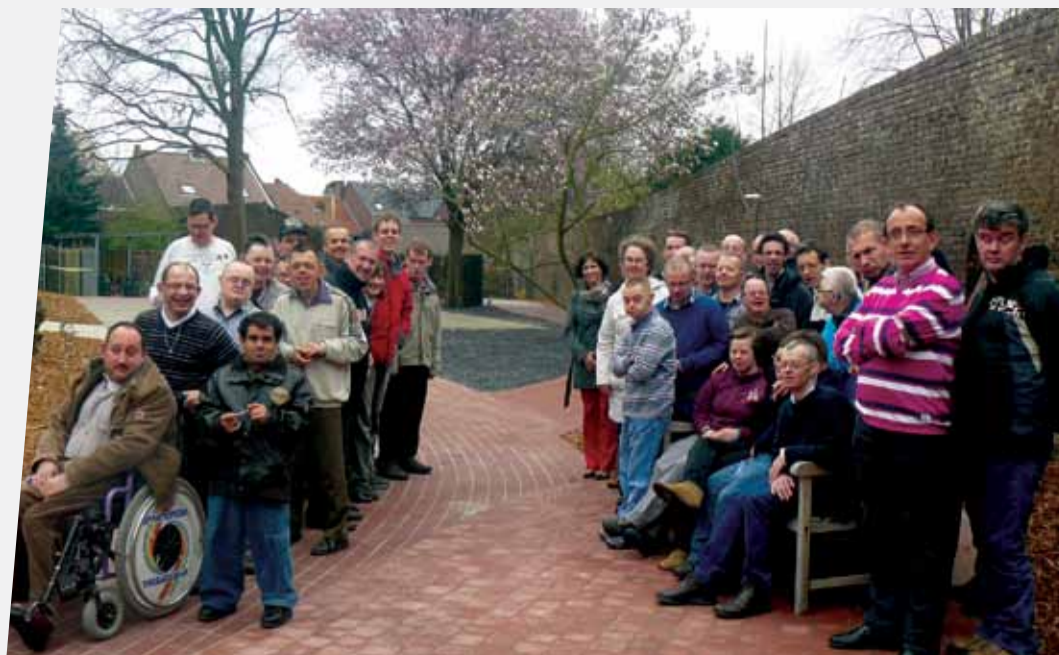
Stradus Infra soutient jardin d'expérience avec plus de 700 m 2 de pavés.

Les différentes zones dans le jardin se distinguent par la couleur des allées. C'est ainsi qu'une piste de go-kart a été réalisée dans un dallage rouge poreux. Certaines zones sportives et de récréation ont été conçues en dalles grises tandis que les zones de repos dans le jardin ont bénéficié de teintes plus chaudes.